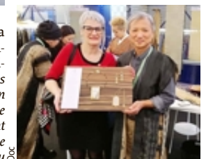
À Paris, l'Engissoise a présenté son travail au maître japonais.